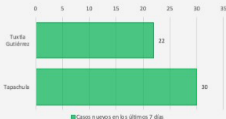
Municipios con mayor número de casos 3