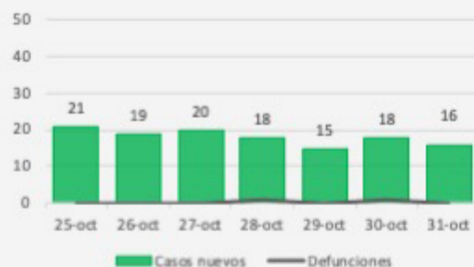
Panorama Covid-19, Chiapas 3